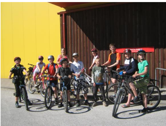
6 ja 7. klassi jalgrattamatka esimene peatuskoht enne pika retke algust Jõgeval.