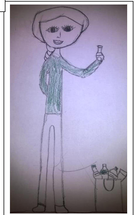
JOONISTUSED: 2. KLASSI SULESEPAD