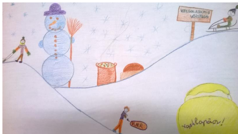
VASTLAPÄEVA ÜRITUS BIRGIT MIADZIELEC, 7. KLASS