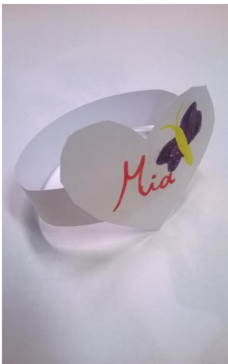
VALENTINIPÄEVAKS LUPE TOPKIN, 2. KLASS