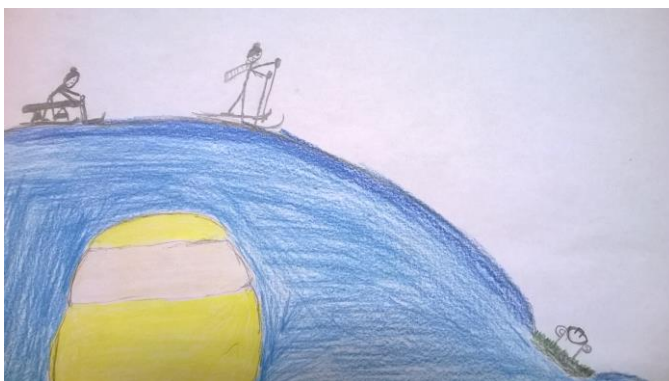
HIIGLKUKKEL JOOSEP JOOR, 7. KLASS