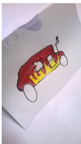
SÕBRALE Lauri Pent 2.klass