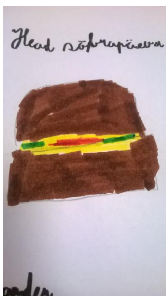
SÕBRAPÄEVAKS Rander Möldre 2.klass