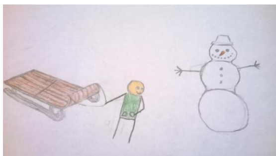
VÄSTLAD Karl-Silver Kõõp 7.klass