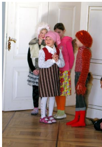
2. ja 4. klassi ühisnäidend