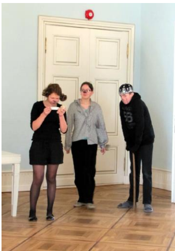
5. klassi etendus