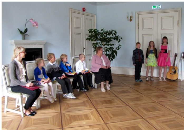
I klassi minejad ja noored laululinnud