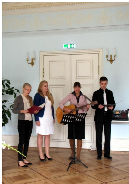
Õpetajate kantri bänd