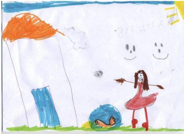
Mai- Liis 1. klass