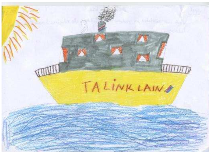
Crystal-Speli 4. klass