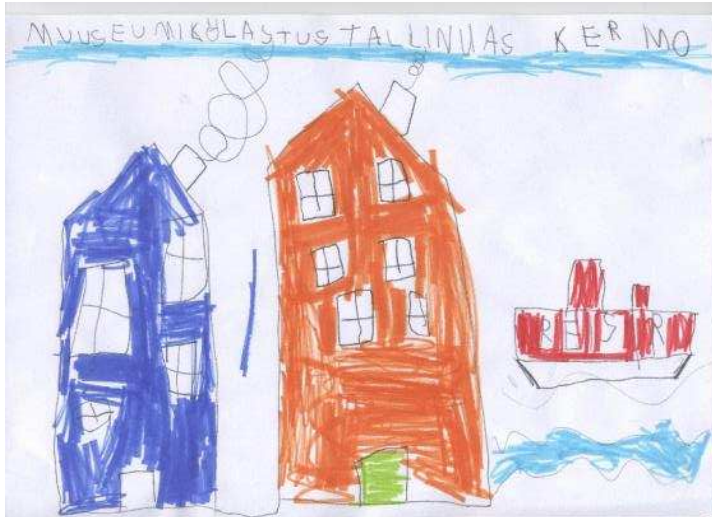
Kermo 1. klass

Me käisime kolmapäeval Tallinnas. Alguses kogunesime Kiltsi rongijaama ja sõitsime Tallinna. Tallinnas saime kaardid ja pidime otsima, kus me asume. Siis läksime vaatama, et kas Soome paistab. Kahjuks oli udu ja me ei näinud Soomet. Siis läksime arhitektuurimuuseumisse. Seal me täitsime ülesandeid. Siis läksime sööma Basiilikusse. Seal kõrval oli Kalevi kommipood. Seal saime raha kulutada. Seal kõrval oli mänguplats. Siis läksime mööda Raekoja platsi rongijaama. Raekoja platsil oli mingi mees, kes seisis. Ühed inimesed panid talle raha ja ta hakkas liikuma nagu robot. Siis läksime rongijaama ja läksime koju. Väga tore päev oli. Mulle meeldis!