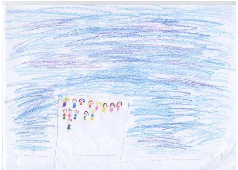
Eliise, 4. klass