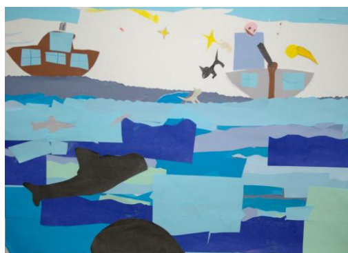
II klassi poiste ühistöö