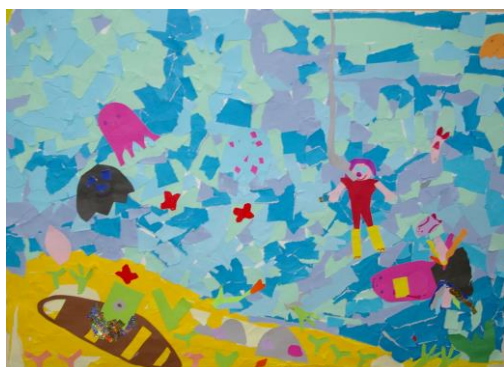
II klassi tüdrukute ühistöö