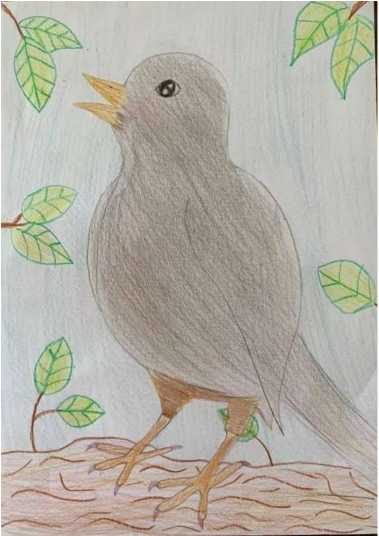
Linell Lasmägi, 6. klass