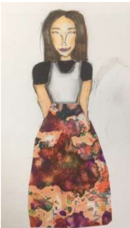
< Riia Rebane >