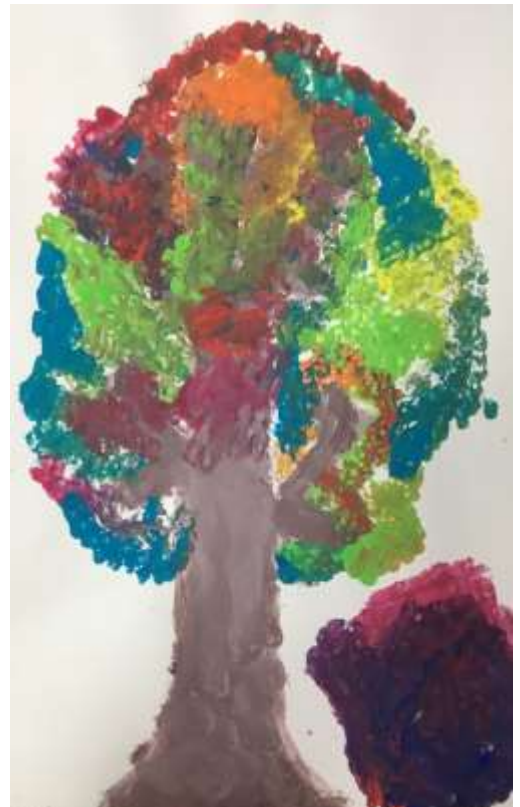
Miina Põllu >