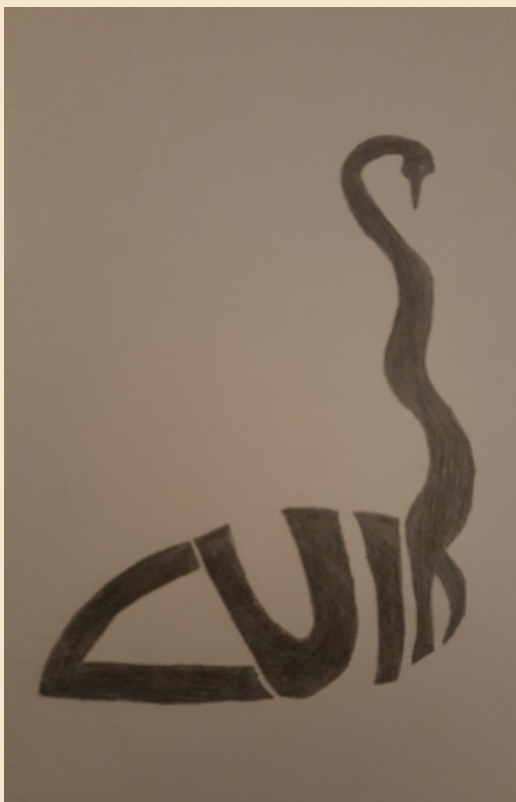
Sören Repo, 7. klass