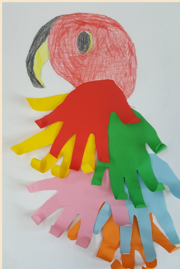
Karel Tollok, 2. klass