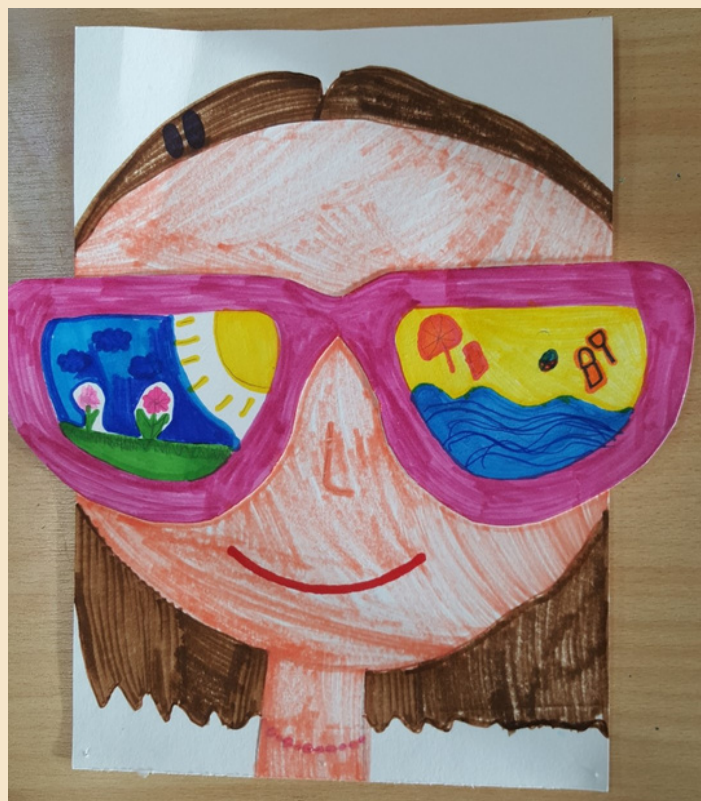
Aleksandra Tšurbakova, 3. klass