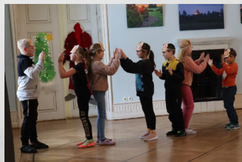
2.- 3. klass