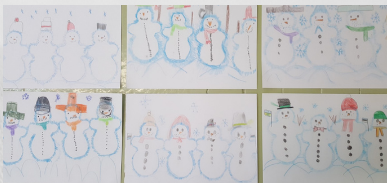
Lumemmele paraad, I klass