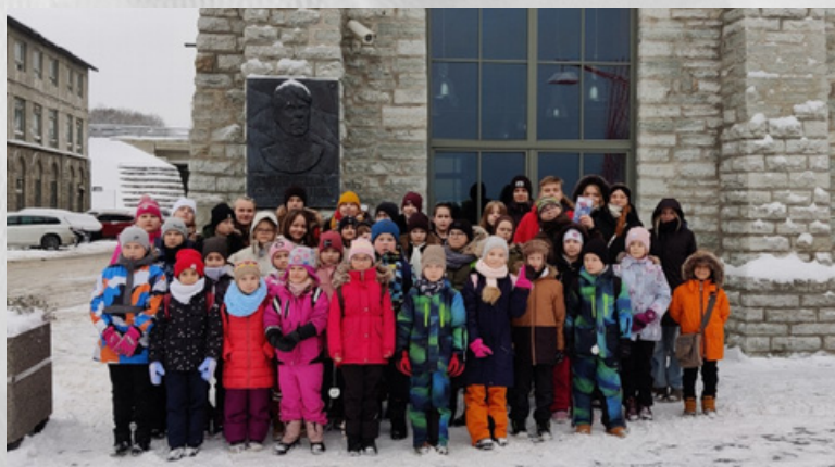
Õpilased admiral Krusensterni bareljeefi ees