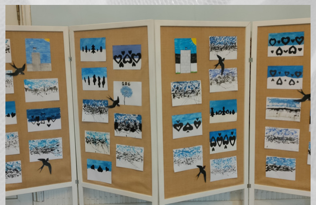
Pajju õnne, Eestil