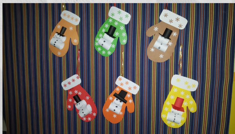
Talverõõmud, II klass