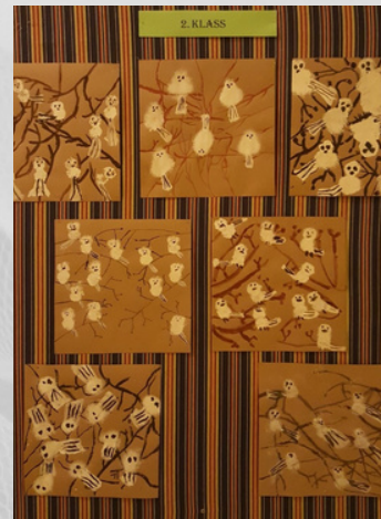
Linnud, I klass